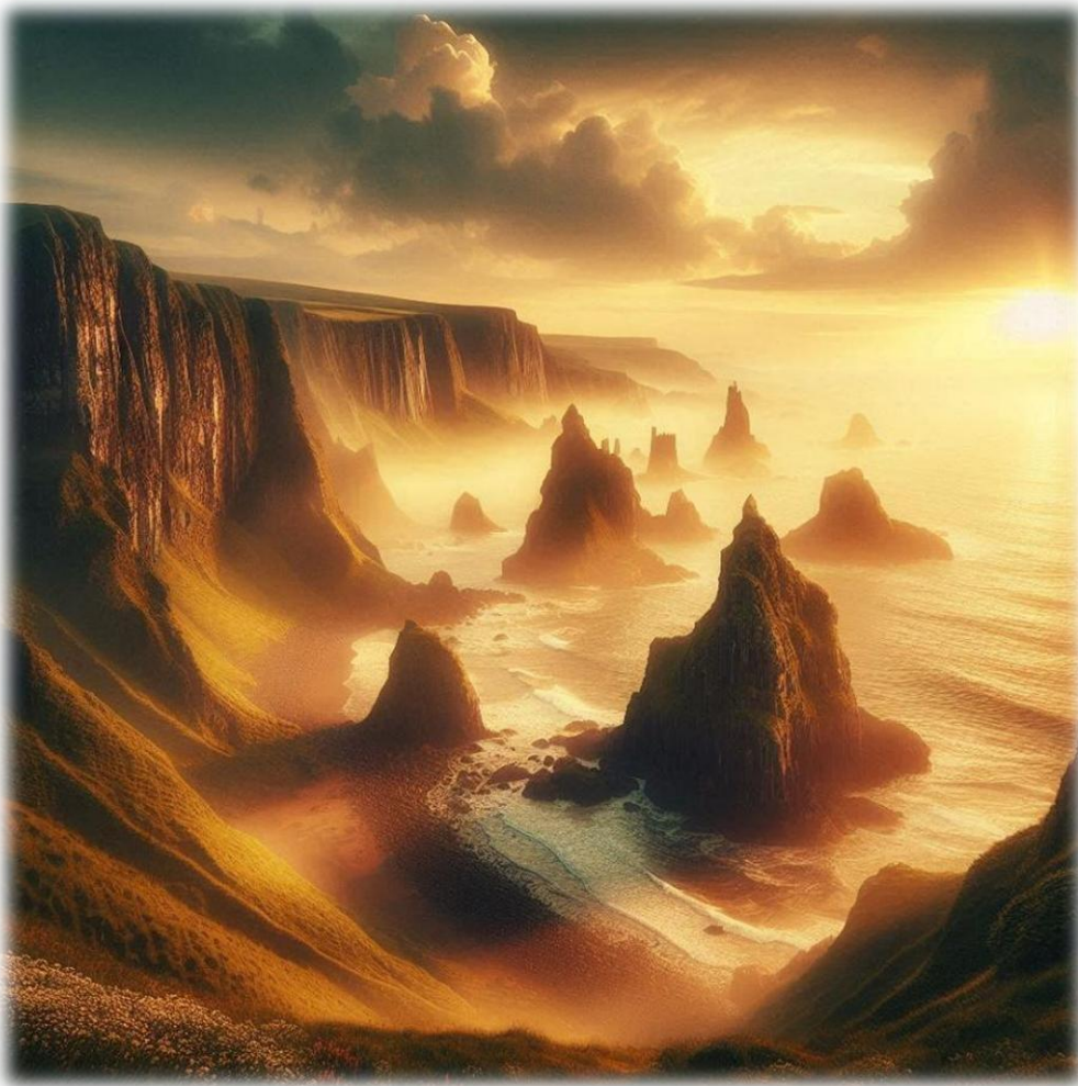
Image © Sylvain S. Simon – Création originale par IA – Avril 2026 –

Oonagh et Finn eurent par la suite une fille prénommée Ailith. Elle était bien plus petite que ses parents, mais sa taille restait impressionnante. Elle avait surtout la force intérieure d'un géant et la sensibilité d'une magicienne. Comme sa mère, elle entendait les pierres chanter. Elle comprenait les courants marins, comme si l'océan lui parlait. Elle appartenait à cet espace fragile où les mythes deviennent des souvenirs et où les souvenirs deviennent des légendes, racontées de génération en génération au coin du feu. Elle avait grandi entre les colonnes de la Chaussée des Géants et avait appris à écouter la terre respirer. La nuit, elle entendait la grotte musicale de Staffa, comme si un fil invisible reliait son cœur aux vagues qui s'y engouffraient. Une fois adulte, Ailith voyagea entre l'Irlande et l'Écosse, guidée par le Chant des Mondes. Là, elle épousa un Highlander. Puis leur descendance se dispersa. Une partie resta en Écosse, une autre retourna en Irlande. Une branche suivit les Déisi, un peuple irlandais en quête de nouvelles terres, jusqu'au Pays de Galles.