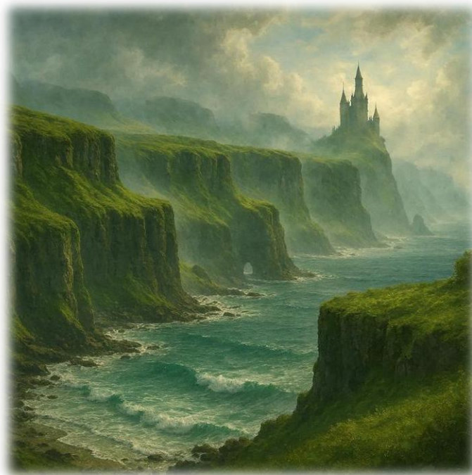
Image © Sylvain S. Simon – Création originale par IA – Avril 2026 –

Les d'Estouteville, alliés aux Beaumont et aux Warenne, portaient en eux la mémoire des rois d'Écosse. Les de Courcy furent de ceux qui franchirent la mer d'Irlande et laissèrent leur empreinte en Ulster, là où les Normands rencontrèrent les Gaëls et où les lignées se mêlèrent comme des courants contraires. Les d'Espinay, nobles bretons, portaient la mémoire des saints armoricains. Les de Mathan, seigneurs du Cotentin, portaient la mémoire des Normands. Les Dursus, enfin, héritèrent de toutes ces mémoires et les transmirent, génération après génération... jusqu'à moi.